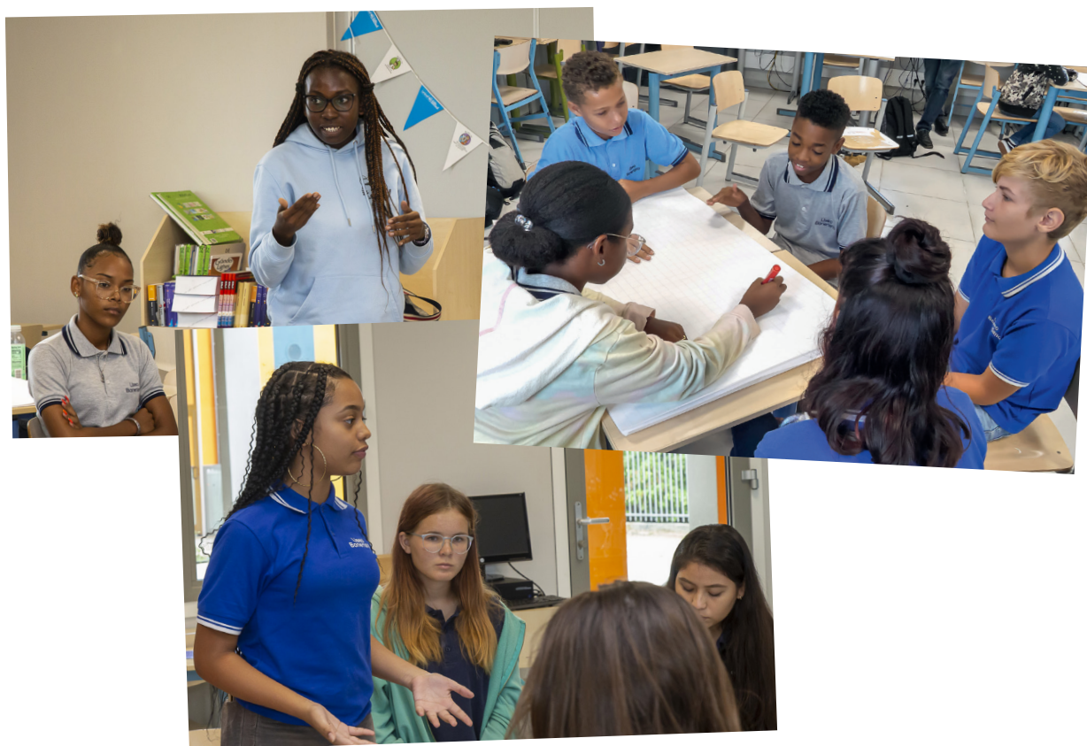
Deelnemers #MijnNieuweWereld, Bonaire.

“Wij vinden het belangrijk om over onze toekomst te praten. De groepsgesprekken bestonden uit een uiteenlopende groep jongeren met allemaal verschillende meningen. Wij hebben het gehad over recente problemen waar we tegenaan lopen en over de dingen die wij belangrijk vinden. Wij hebben de thema's jeugdparticipatie, verkeersveiligheid voor fietsers en sport, en mentale hulp op school de prioriteit gegeven. Maar er zijn nog meer onderwerpen waarover we advies hebben. Zelfs als we niet persoonlijk met een probleem te maken krijgen, kunnen we er toch iets over zeggen en onze stem laten horen. Wij hopen oprecht dat de overheid iets met ons advies gaat doen.”