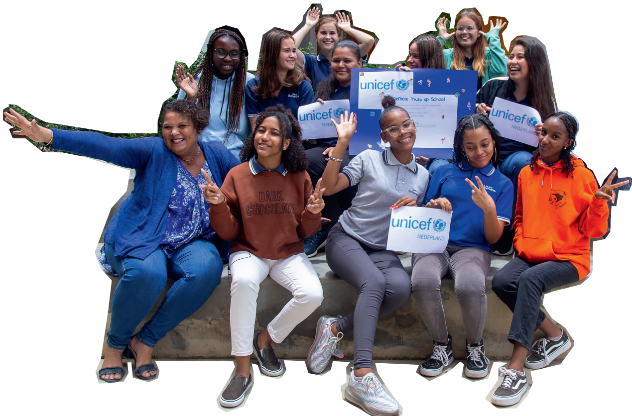
Deelnemers #MijnNieuweWereld, Bonaire.